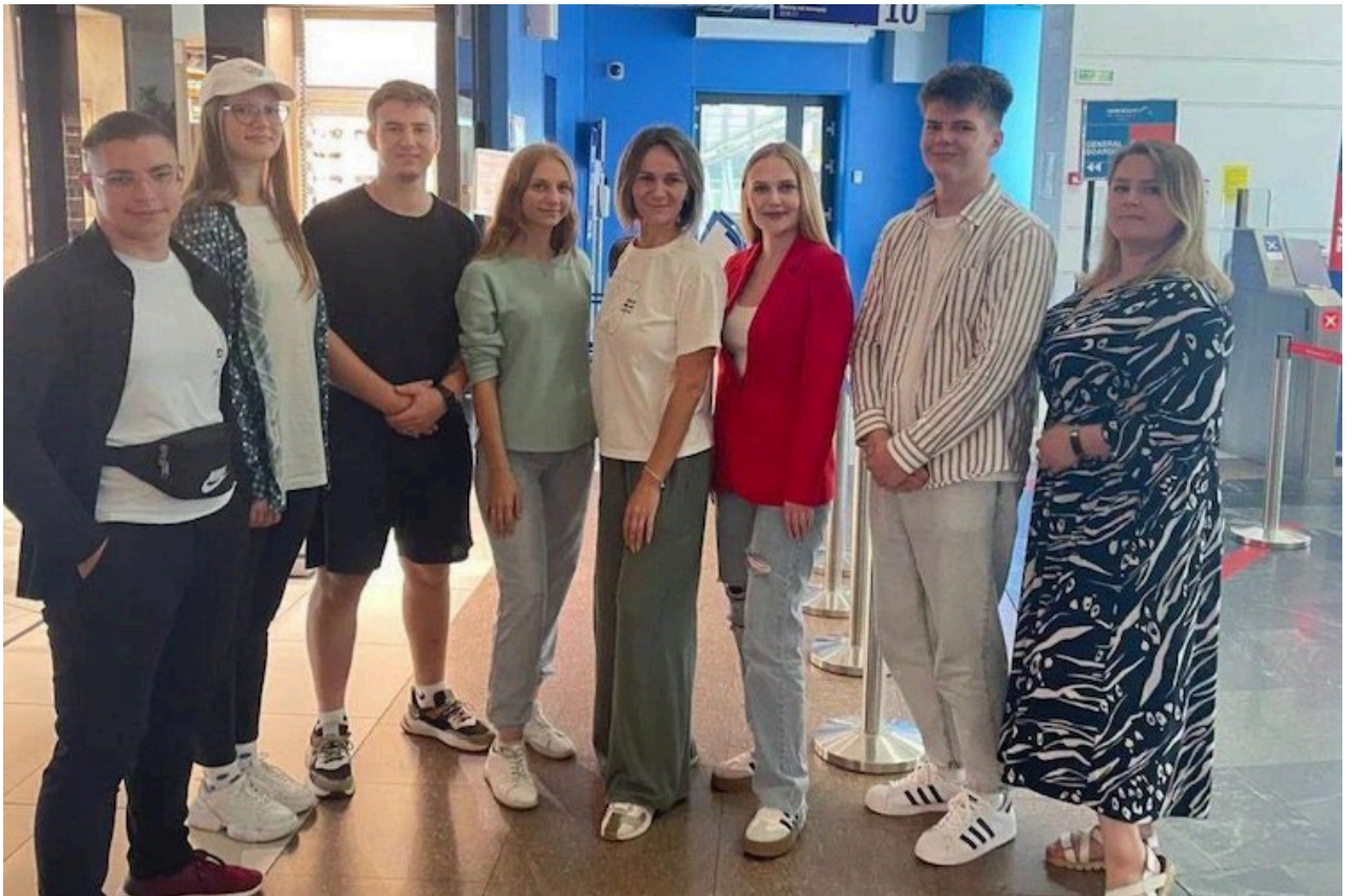
Подготовлено пресс-службой