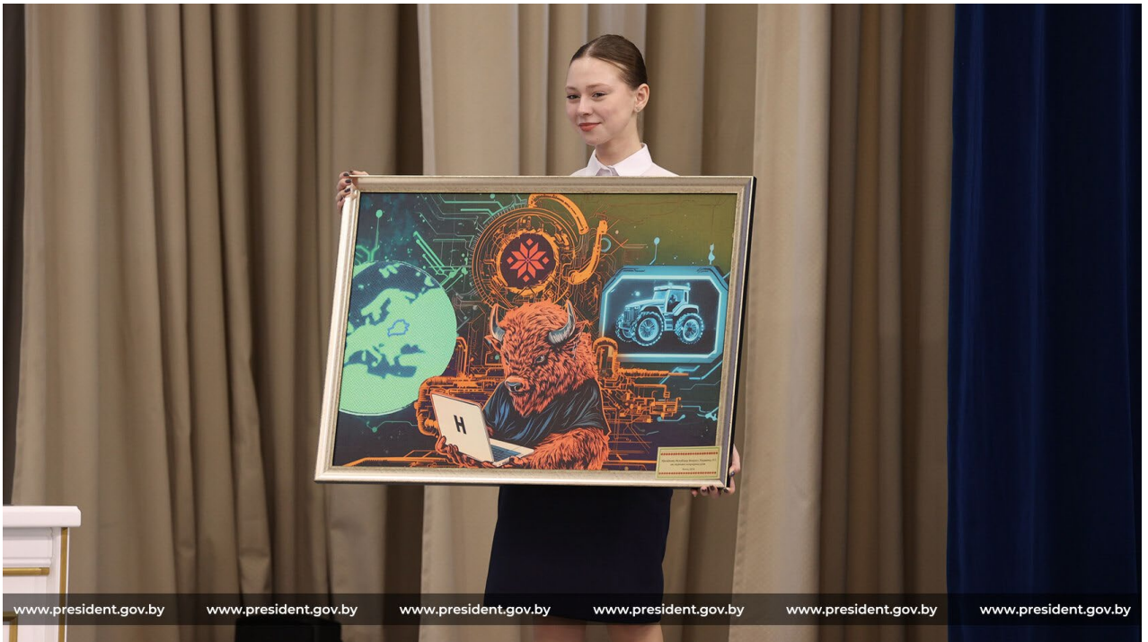
Подготовлено пресс-службой по материалам БелТА и SB.BY