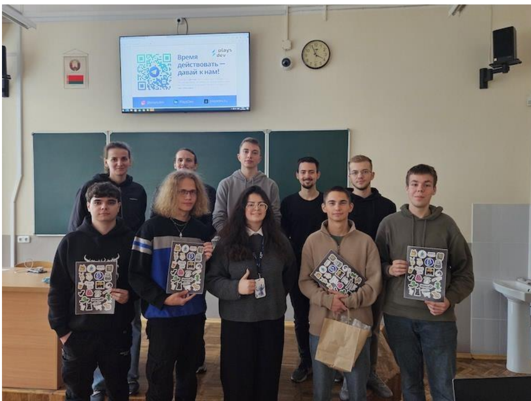
Подготовлено пресс-службой