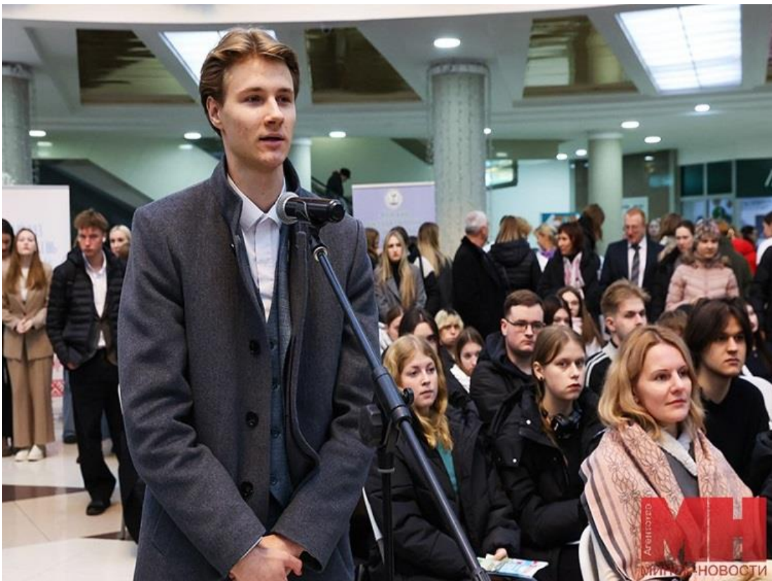
Подготовлено пресс-службой