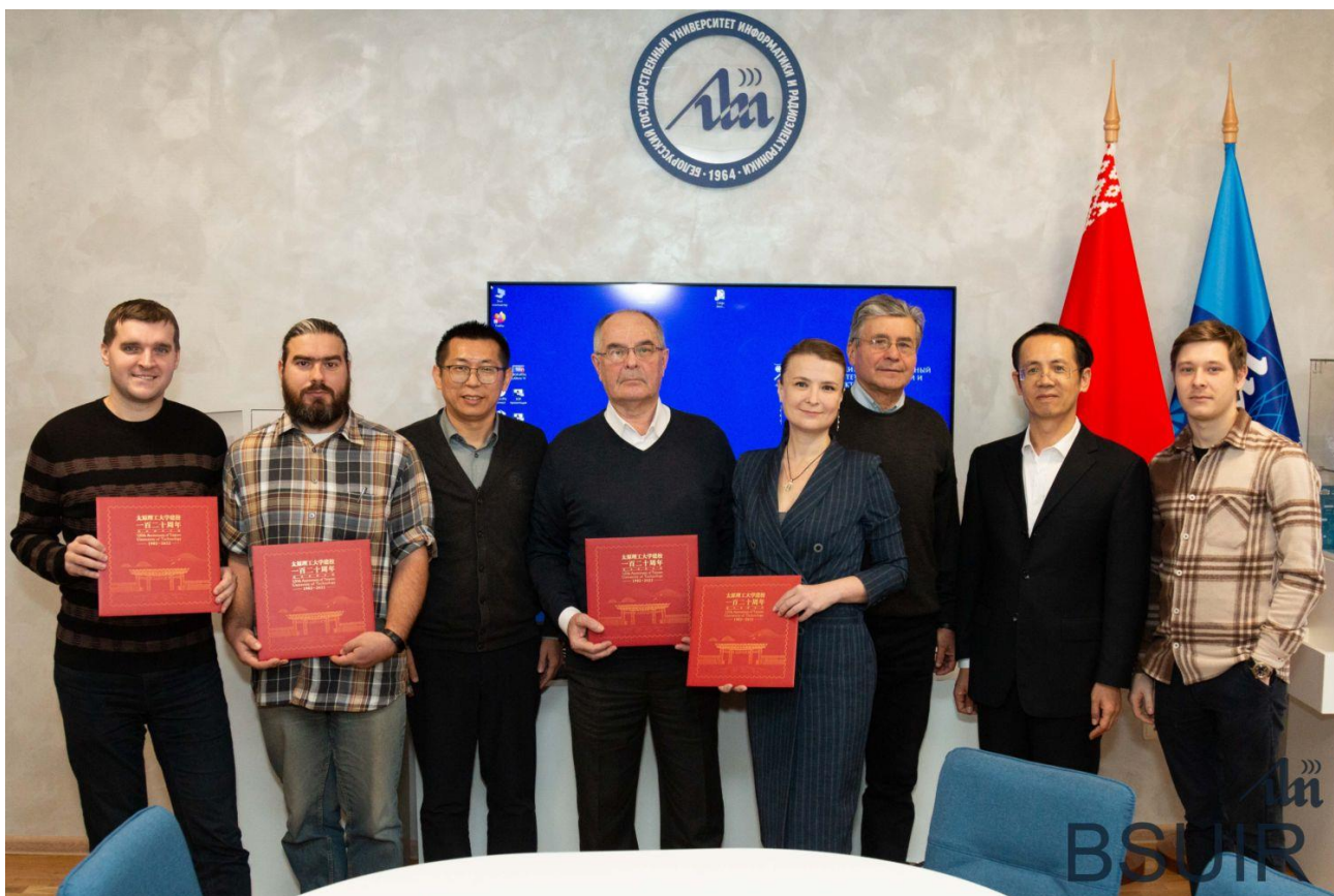
Подготовлено пресс-службой Фото Максима Максака