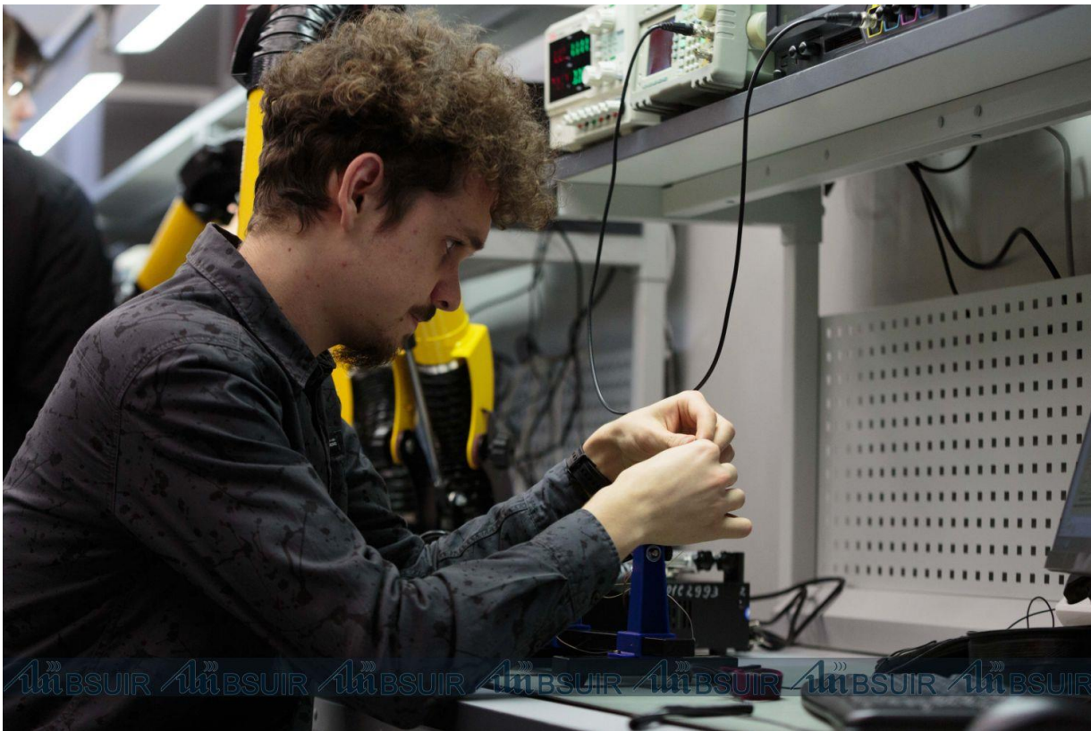
Подготовлено пресс-службой