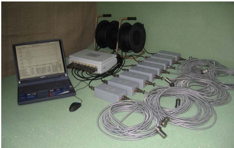
Рисунок 2. ИВК «Тембр» для непрерывной регистрации вибрационных сигналов

Измерительно-вычислительный комплекс "Тембр" (рис. 2) содержит следующие функциональные узлы и блоки: канал виброизмерительный двухкомпонентный (до 8), состоящий из двухкомпонентного виброизмерительного преобразователя и согласующих усилителей с полосовой частотной фильтрацией; блок ввода цифровых кодов в компьютер по USB каналу, содержащий 16-и канальный АЦП, аналоговый коммутатор и конвертор питающего напряжения; мобильный компьютер типа Note-Book; соединительные кабели (до 50 метров).