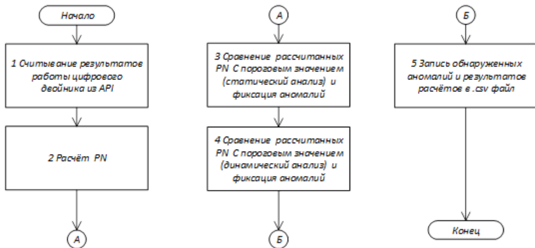
Рисунок 2. Алгоритм работы программного обеспечения для поиска аномалий в работе солнечных панелей, разработанного на основе цифрового двойника

Для анализа данных использовались нормализованные значения мощностей в MPP P_N для всех солнечных панелей. Рассчитанные значения сравнивались с медианными значениями и по результатам сравнения относились к дефектным или в пределах нормы. При этом анализ осуществлялся в пределах одного месяца (статический анализ) или в сравнении от месяца к месяцу (динамический анализ). Алгоритм программного обеспечения отражён на рисунке 2.