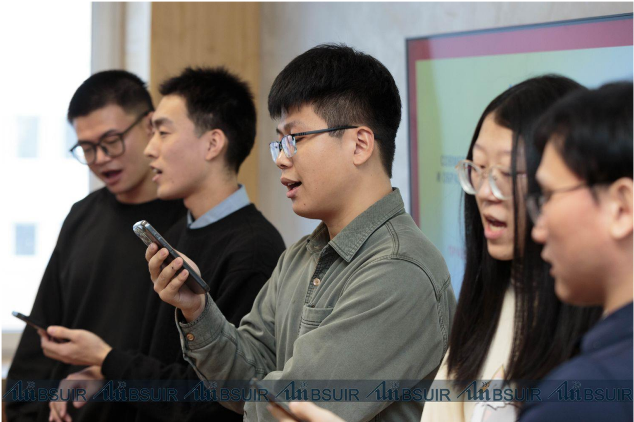
Подготовлено пресс-службой