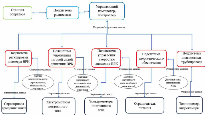
Рис. 3. Структура системы управления ВРК

Разработанная конструкция внутритрубного устройства представляет нетривиальную задачу по созданию системы управления. Ввиду движения устройства в криволинейном участке типа отвод, использование кабель-троса с использованием оптоволокна не является допустимым при возникновении высокой вероятности излома данного кабеля о внутритрубную поверхность, также существующие системы управления, представленные в [6-10], не являются эффективными для управления движением новой конструкцией по участкам сложной геометрии. Вследствие чего была разработана система управления ВРК, которая включает в себя подсистему радиосвязи для передачи и приёма данных в системе управления, структура представлена на рис. 3.