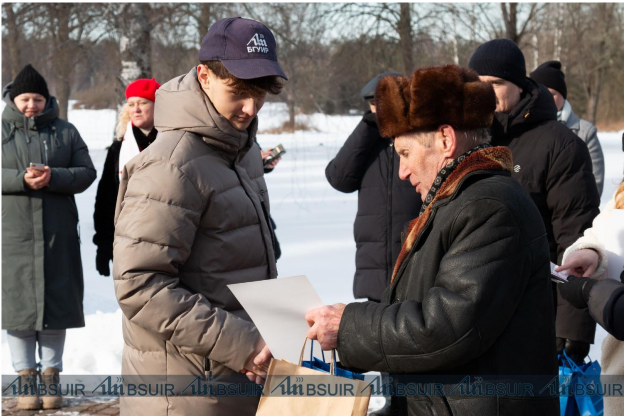
Падрыхтавана прэс-службай