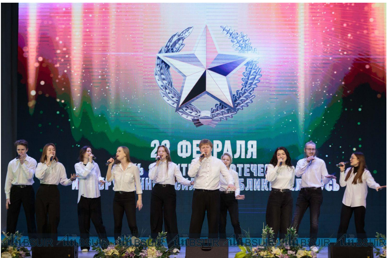
Гэтым жа днём курсанты БДУІР паўдзельнічалі ў мітынгу на Вайсковых