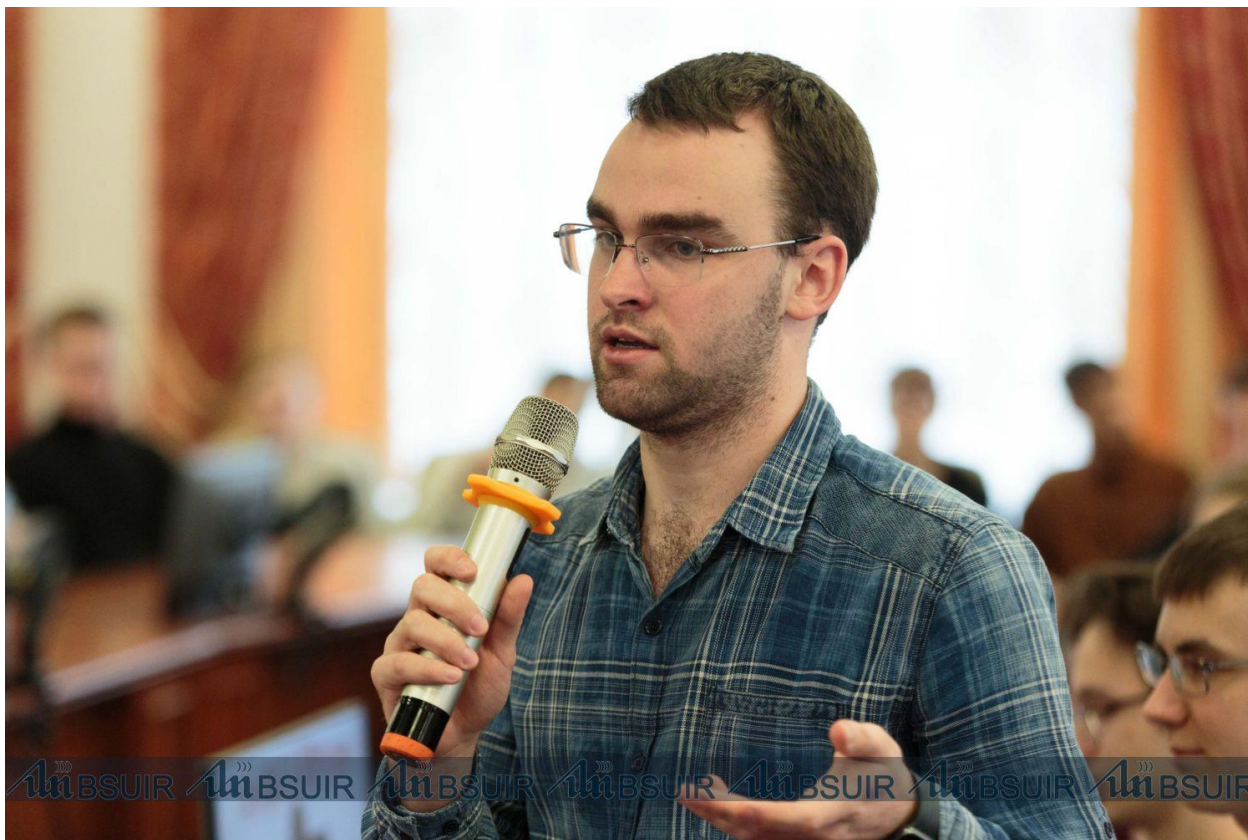
Подготовлено пресс-службой