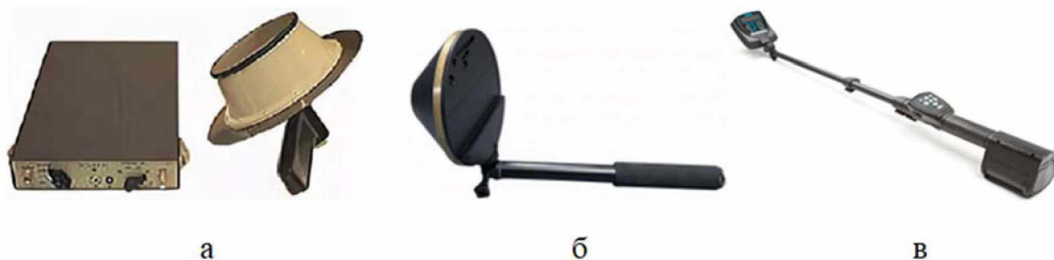
Рис. 2 Модели нелинейных локоаторов, занявшие первые три места по комплексным арифметическим показателям качества: а – ОКТАВА-М; б – NR-BT mini; в – ORION 2.4

Как показали результаты расчетов, наилучшие значения комплексных показателей качества были у модели ОКТАВА-М (0,67), на втором месте – NR-BT mini (0,56) и на третьем месте – ORION 2.4 (0,52) (рис. 2).