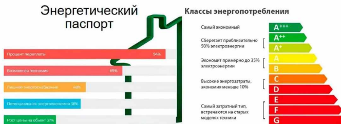
Рис. 1. Классы энергоэффективности здания

Энергопаспорт здания содержит информацию о теплотехнических характеристиках здания, энергопотреблении, энергоснабжении и другие данные, позволяющие определить эффективность использования энергии в данном здании. Создание электронных энергопаспортов позволит обеспечить в совокупности за весь срок службы здания экономическую выгоду в капитальных ремонтах, техническом обслуживании, проведении мероприятий по повышению энергоэффективности, а также сократить трудозатраты на поиск сведений об энергетической эффективности здания для предварительной оценки объёма работ по ремонту (реконструкции) и составления технического задания на выполнение работ.