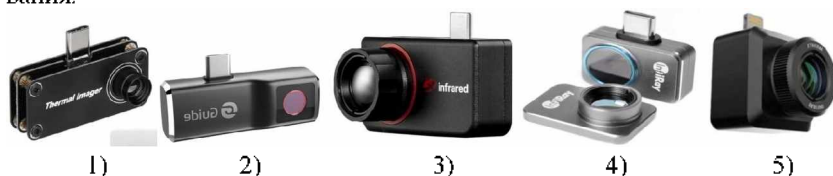
Рис. 2. Вид тепловизоров

В результате анализа технико-экономических характеристик, приведенных в таблице 2 тепловизоров (рис.2), выбран современный тепловизор Fawoony TI (Fawoony Thermal Imager) для контроля температуры оборудования.