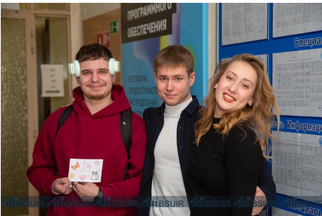
Подготовлено пресс-службой