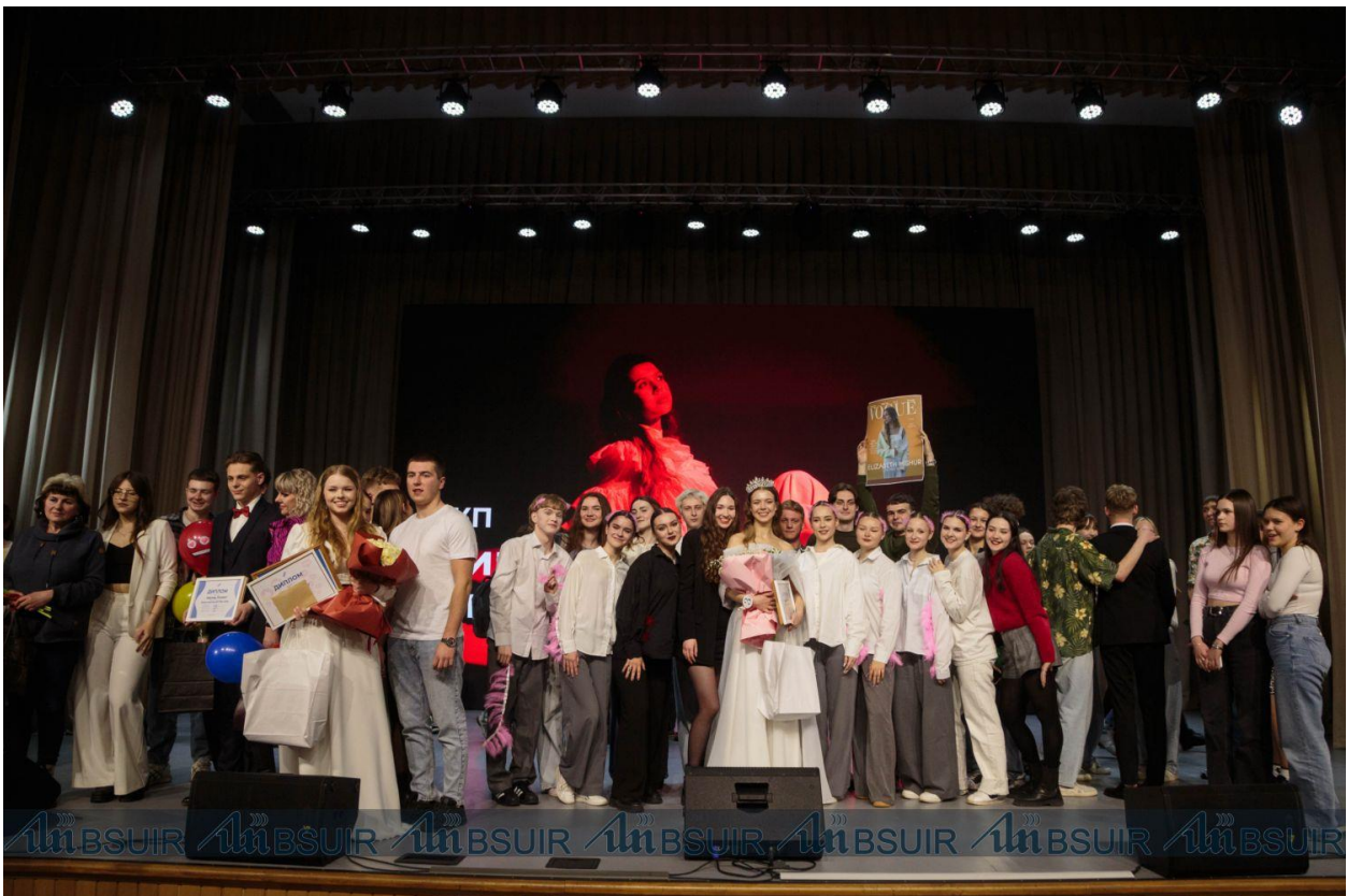
Подготовлено пресс-службой