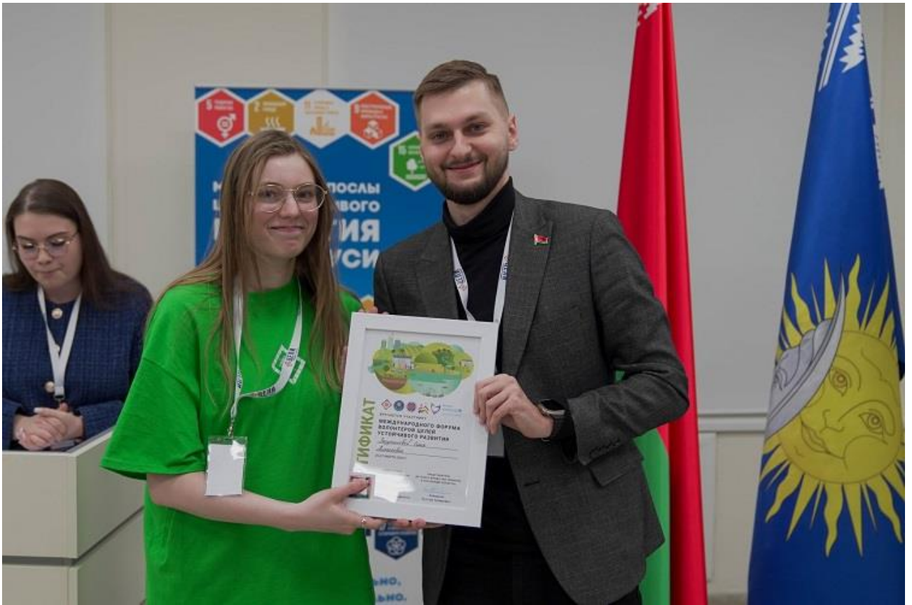
Подготовлено пресс-службой Фото организаторов форума