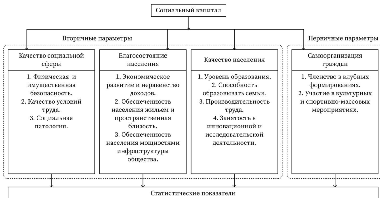
Рисунок 1 – Система показателей социального капитала региона

Выявление наиболее информативных групп показателей выполнено по данным официальной статистики и на основании анализа существующих подходов к построению индикаторных моделей оценки социального капитала. Показатели качества социальной сферы, благосостояния и качества населения составляют вторичные операциональные параметры социального капитала – его последствия на уровне региона. Показатели, сгруппированные в свойство «Самоорганизация граждан», характеризуют составляющие социального капитала, то есть первичные операциональные параметры: социальные сети и связанные с ними нормы, ценности и доверие в различных его проявлениях.