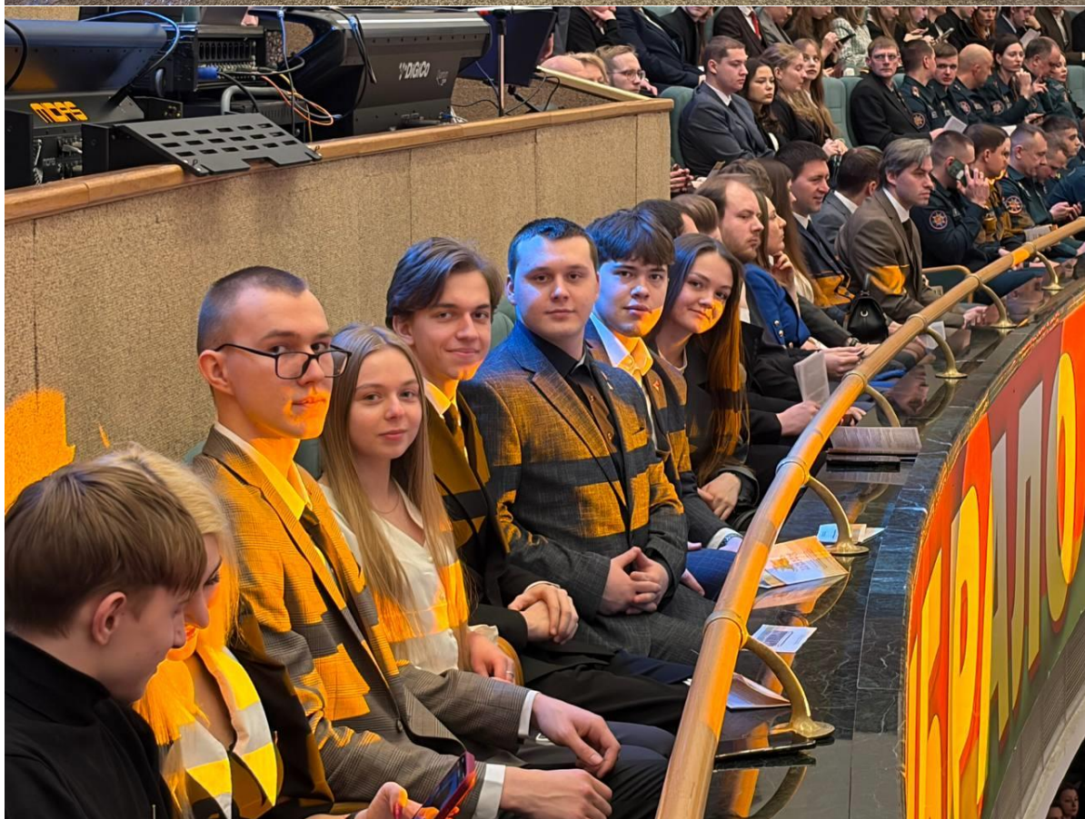
Подготовлено пресс-службой