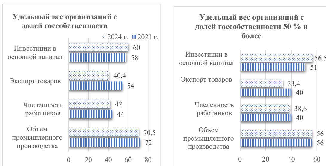
Рисунок 2 – Институциональная структура белорусской экономики в 2021 и 2024 гг.

Вместе с тем институт частной собственности достаточно развит в отдельных сферах деловых и потребительских услуг, что подтверждается динамикой показателей малого и среднего бизнеса. Так, на рисунке 3 видно, как на определенных этапах эволюционного развития белорусской модели рыночная трансформация осуществлялась ускоренными темпами, что нашло отражение в 7-летних циклах деловой активности сектора предпринимательства.