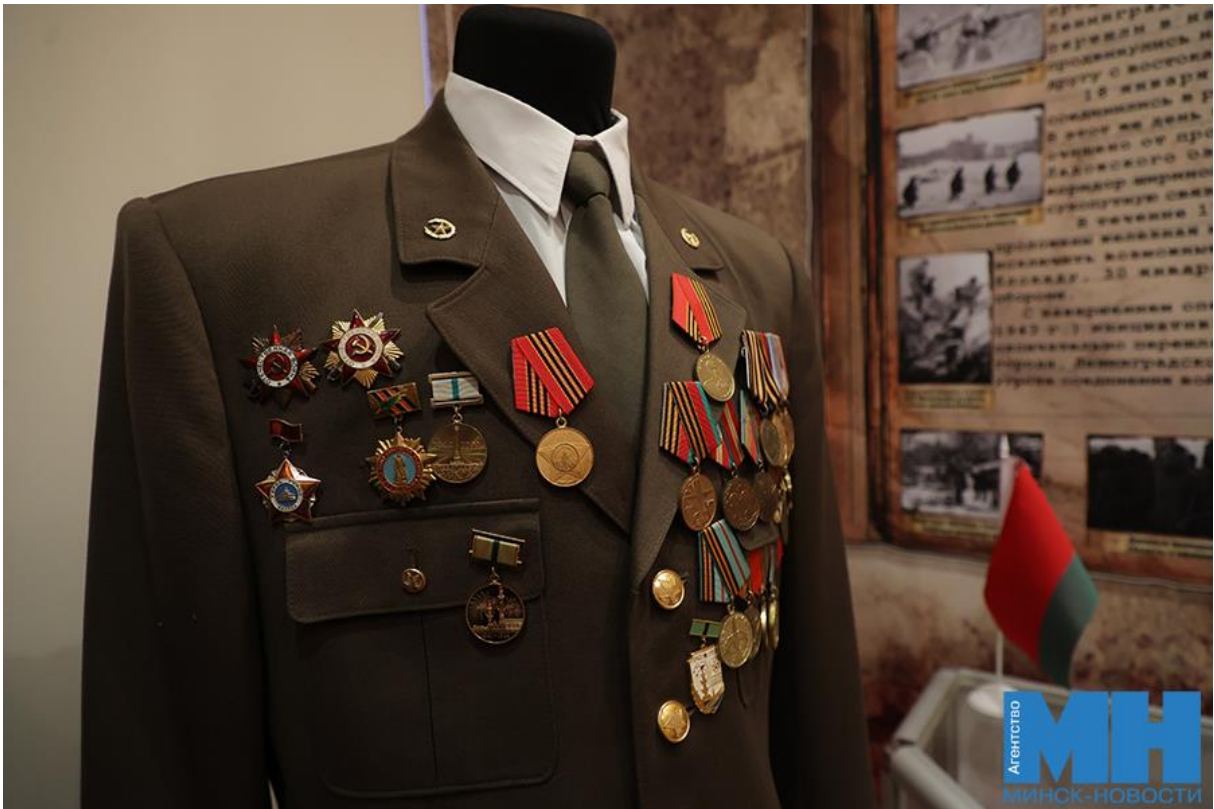
— Насколько был сплочен народ, чтобы отстоять свою Родину! — подчеркнул председатель Мингорсовета, обращая внимание на то, что этот пример должен быть показательным для каждого поколения.