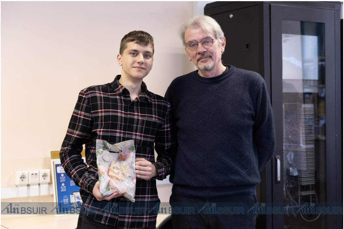
Подготовлено пресс-службой