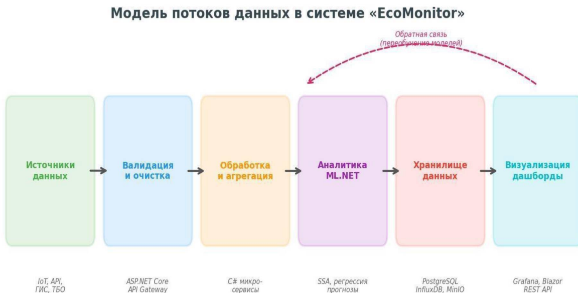
Рисунок 2. Модель потоков данных в системе «EcoMonitor»

Модель потоков данных в системе представлена на рисунке 2. Данные последовательно проходят этапы от источников через валидацию, обработку и агрегацию в микросервисах на C# до аналитического модуля ML.NET, результаты которого визуализируются на дашбордах конечных пользователей.