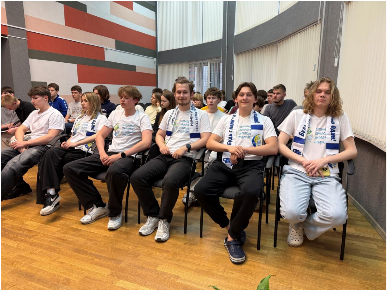
Подготовлено пресс-службой Фото участников мероприятия