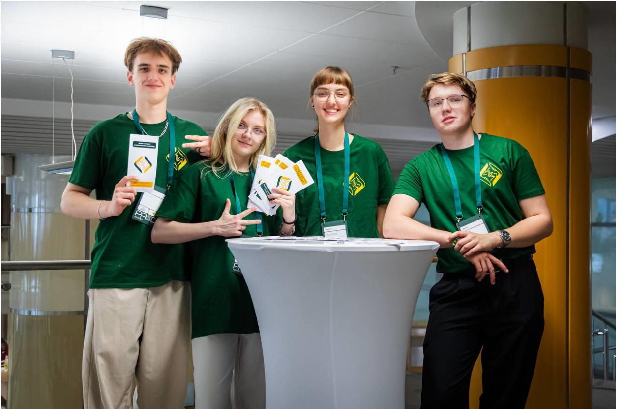
Текст и фото предоставлены участниками мероприятия