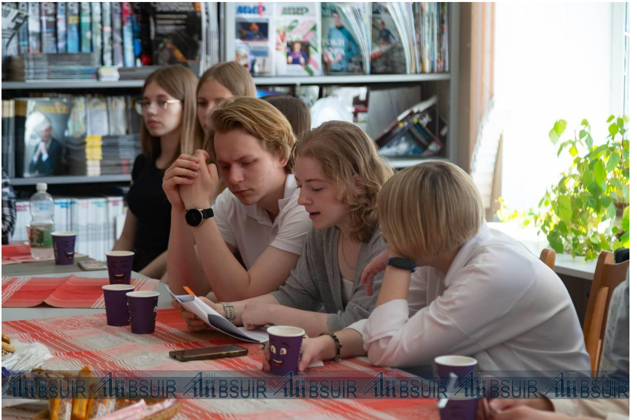
Падрыхтавана прэс-службай