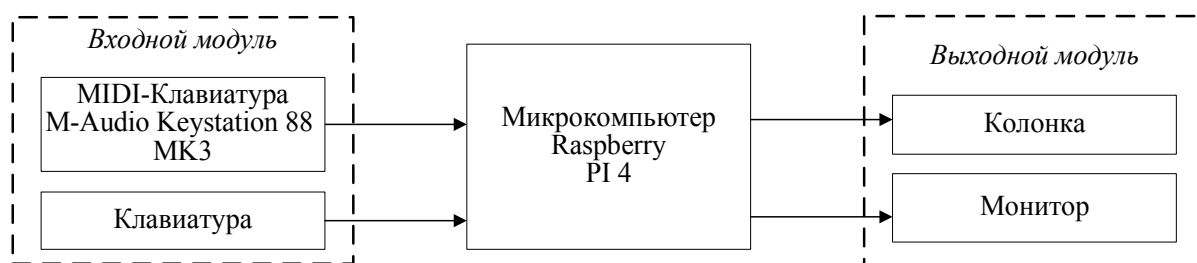
Рисунок 1 – Структура разработанного устройства

Структурная схема устройства представлена на рисунке 1.