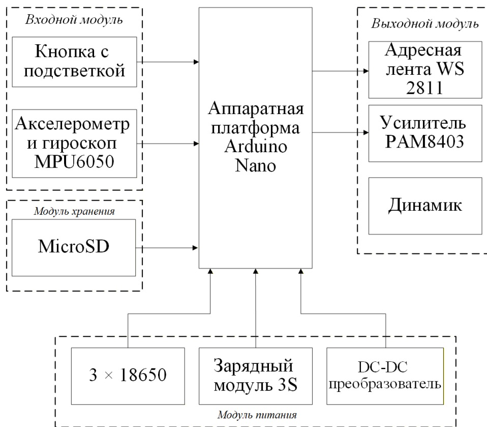
Рисунок 1 – Структура разработанного устройства

Структурная схема устройства представлена на рисунке 1.