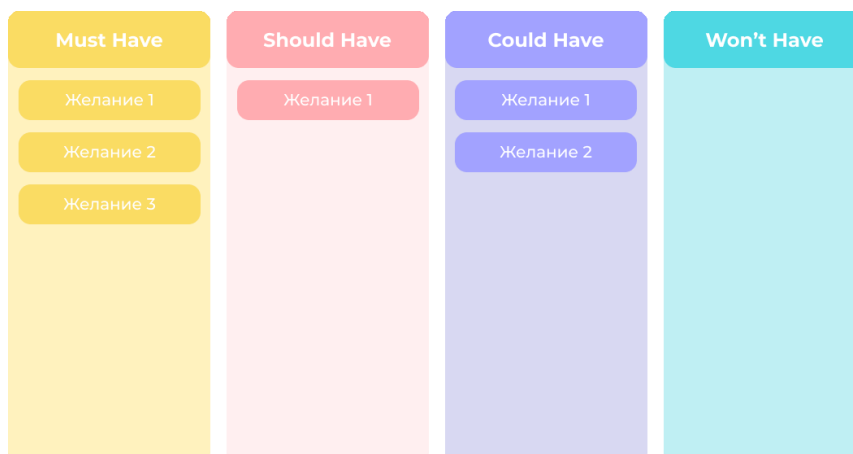
Рисунок 1 – Пример визуального распределения желаний по методу MoSCoW

Пользователю предоставляется возможность ранжировать добавляемые элементы по степени их субъективной значимости и необходимости. В качестве системы расстановки приоритетов был выбран метод MoSCoW, который определяет четыре категории задач: Must-have (критически важные), Should-have (желательные), Could-have (допустимые) и Won't-have (отложенные) [2]. Пример визуального распределения желаний по методу MoSCoW проиллюстрирован на рисунке 1.