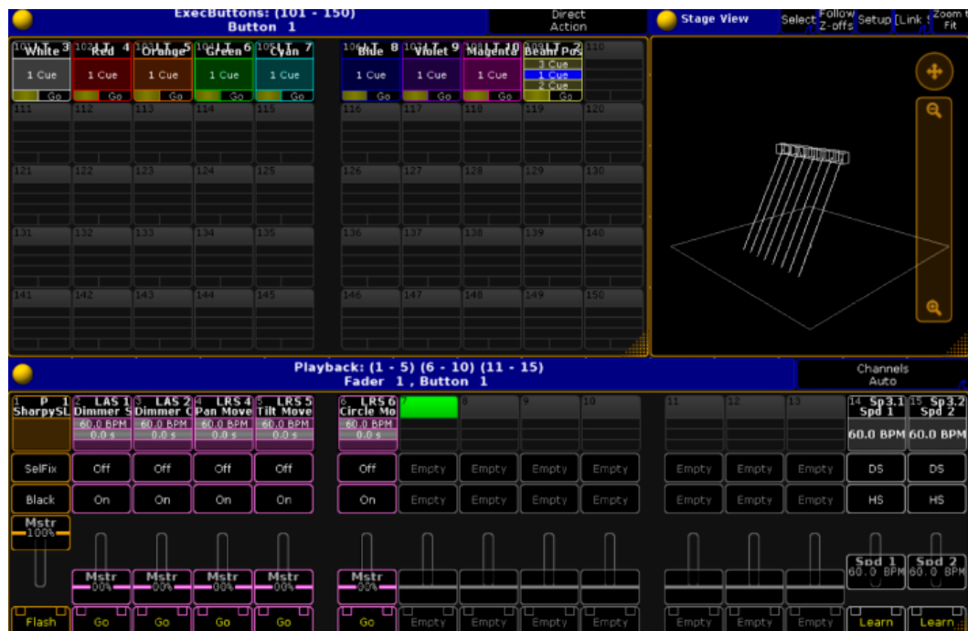
Рисунок 1 – Пример маппинга MIDI -контроллера в программе GrandMa2

На рисунке 1 изображен пример подключения контроллера к ПК с последующим назначением адресов для органов управления