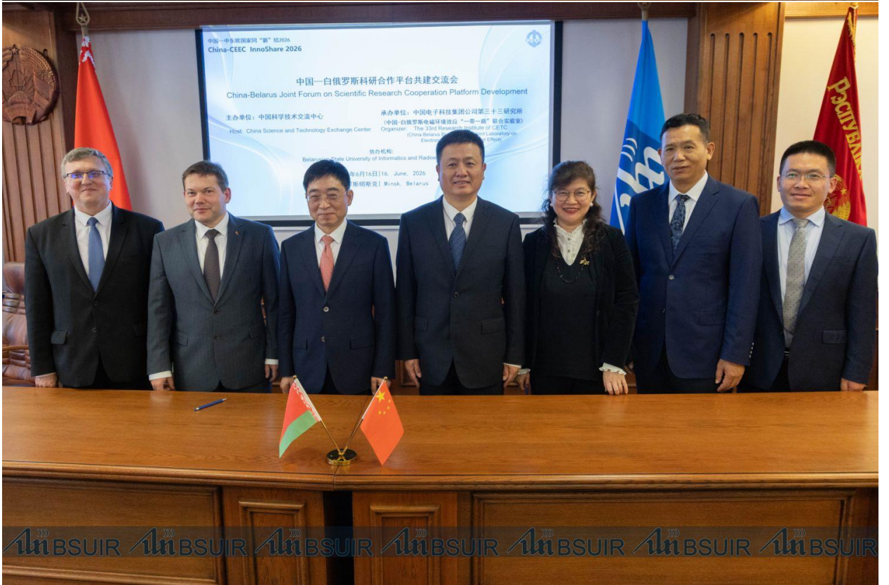
Подготовлено пресс-службой