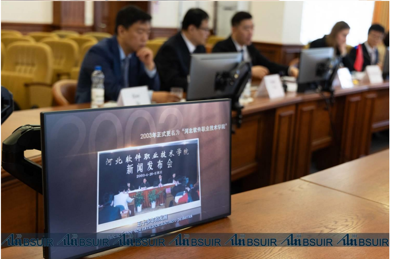
Подготовлено пресс-службой