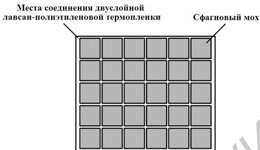
Рис. 1. Схематическое изображение модулей конструкции экрана ЭМИ на основе водосодержащих сфагновых мхов

Значения коэффициентов передачи и отражения ЭМИ исследованных модульных конструкций экранов ЭМИ на основе влагосодержащих сфагновых мхов измерялись в диапазоне частот 0,7...17 ГГц с использованием панорамного измерителя SNA 0,01–18, согласно методике, представленной в [3].