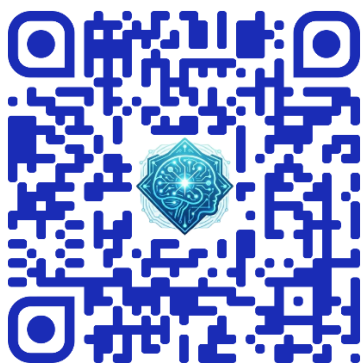
Рисунок 3 – QR-код для перехода на сайт проекта

В качестве интерактивного расширения проекта и перенаправления учителей к практическим инструментам разработан отдельный сайт (рисунок 2), созданный специально для данного проекта. Это самостоятельный веб-ресурс, не являющийся разделом школьного сайта, что позволяет ему иметь собственную структуру, дизайн и адрес, полностью подчинённые задачам проекта. Сайт доступен по QR-коду с баннера и буклета, а также по прямой ссылке, указанной на всех материалах проекта ( http://rogovomu.beget.tech/index.html ) (рисунок 3).