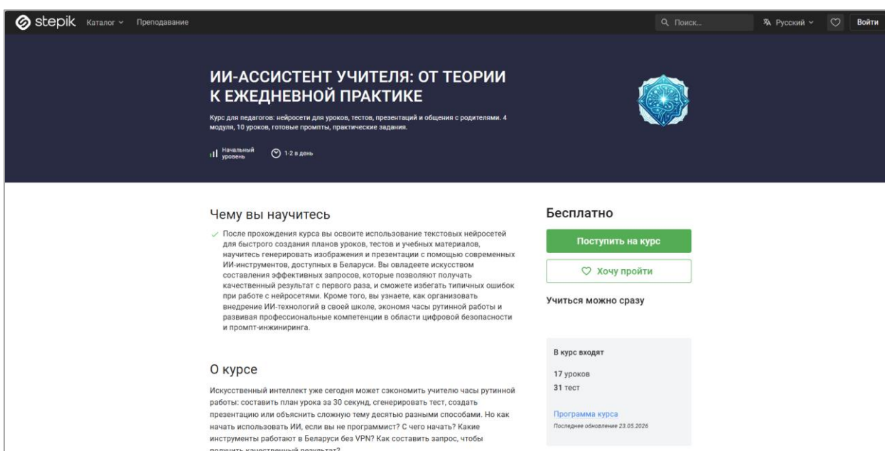
Рисунок 5 – Поддерживающий курс на Stepik

Помимо сайта, центральным элементом системы обучения педагогов стал бесплатный курс на платформе Stepik (рисунок 5, [2]).