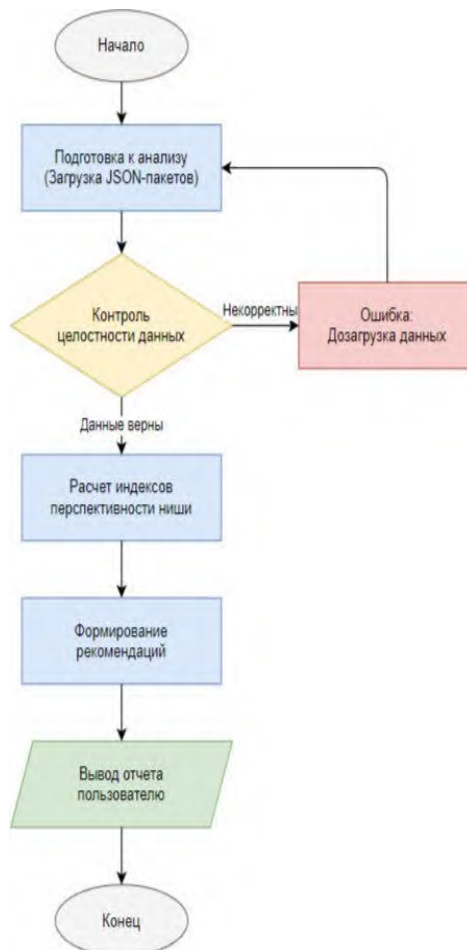
Рисунок 2 – Алгоритм функционального аналитического модуля программного средства

Общий алгоритм функционирования модуля аналитики, отвечающего за поиск перспективных ниш, представлен в виде блок-схемы (рисунок 2). Данная схема отражает логику преобразования «сырых» данных о продажах в конкретные рекомендации.