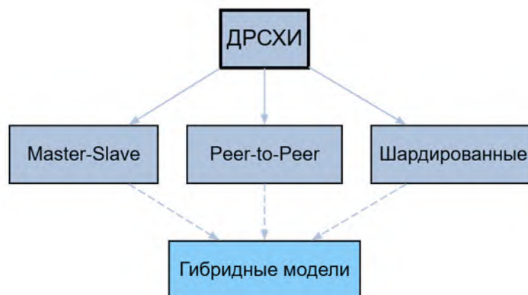
Рисунок 1 – Схема архитектур моделей ДРСХИ

Архитектуры моделей представлены на рисунке 1.