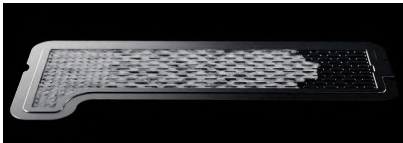
Рисунок 1– Паровая камера смартфона

К активным технологиям охлаждения относятся: микровентиляторы и системы жидкостного охлаждения. Микровентиляторы гонят холодный воздух из внешней среды через теплораспределительную пластину процессора и выводят наружу, однако имеют недостаток в виде шума и механического износа. Стоимость такой технологии примерно равно стоимости паровых камер, однако эффективность выше. Инновационная система жидкостного охлаждения AquaCore Cooling System, реализованная в смартфоне RedMagic 11 Pro. Это первая массовая система, реализующая активную циркуляцию жидкости внутри смартфона. Система представляет собой двухканальную конструкцию, сочетающую жидкостное и воздушное охлаждение. Процесс терморегуляции включает в себя три этапа: