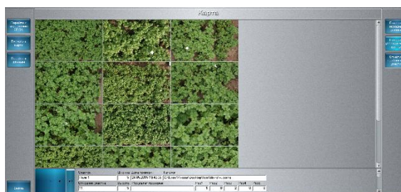
Рис. 2. Вид карты с неотсортированными фотографиями

Главное окно программы содержит семь опций, расположенных слева и справа окна. В центре находится область для отображения исходных данных и результатов поэтапной работы алгоритма. На рис. 3 показан вид окна программы с картой (неотсортированные фотографии). Чтобы показать фотографии в соответствии с их координатами, необходимо нажать кнопку «Показать упорядоченные данные».