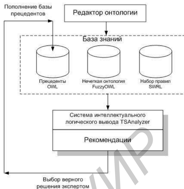
Рисунок 3 – Схема алгоритма формирования базы прецедентов

Помимо этого, наличие базы прецедентов позволяет внести элемент обучаемости данного алгоритма.