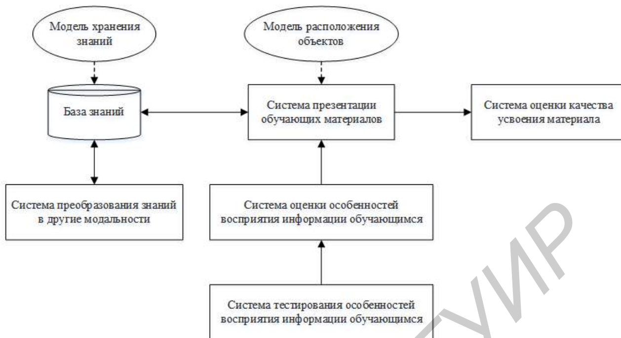
Рисунок 1 – Общая архитектура работы адаптивной системы обучения

позволяет варьировать модальности для максимального усвоения информации, для чего необходимо учитывать ряд факторов, таких как особенности восприятия информации получателем.