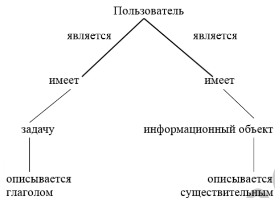
Рисунок 2 – Концептуальная модель онтологии действий пользователя

Вышеупомянутые подчеркивающие линии указывают на родовые существительные информационного объекта.