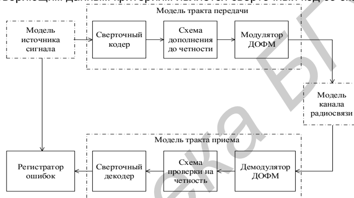
Рисунок 1.2 – Структурная схема модели одноканальной системы радиосвязи с включением в состав изделия АТ3004Д сверточного кодера

Наиболее удовлетворяющим данным критериям является сверточный код со скоростью 0,5.