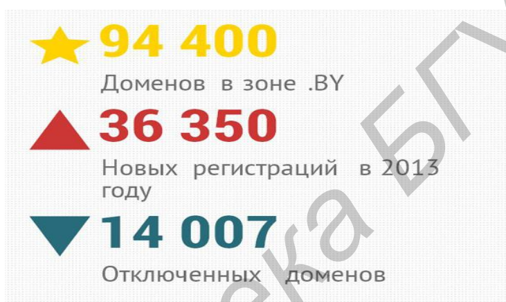
Рис.1 Статистика регистрации новых доменных имен в «Байнете».

Делаете ли Вы покупки в Интернете? Да? Не удивительно.... И Вы в этом не одиноки! Все больше и больше граждан Беларуси предпочитают делать покупки, выбирать услуги при помощи всемирной паутины. По статистике hoster.by за последний год было зарегистрировано 36 350 (Рис. 1) новых доменных имен в «Байнете».