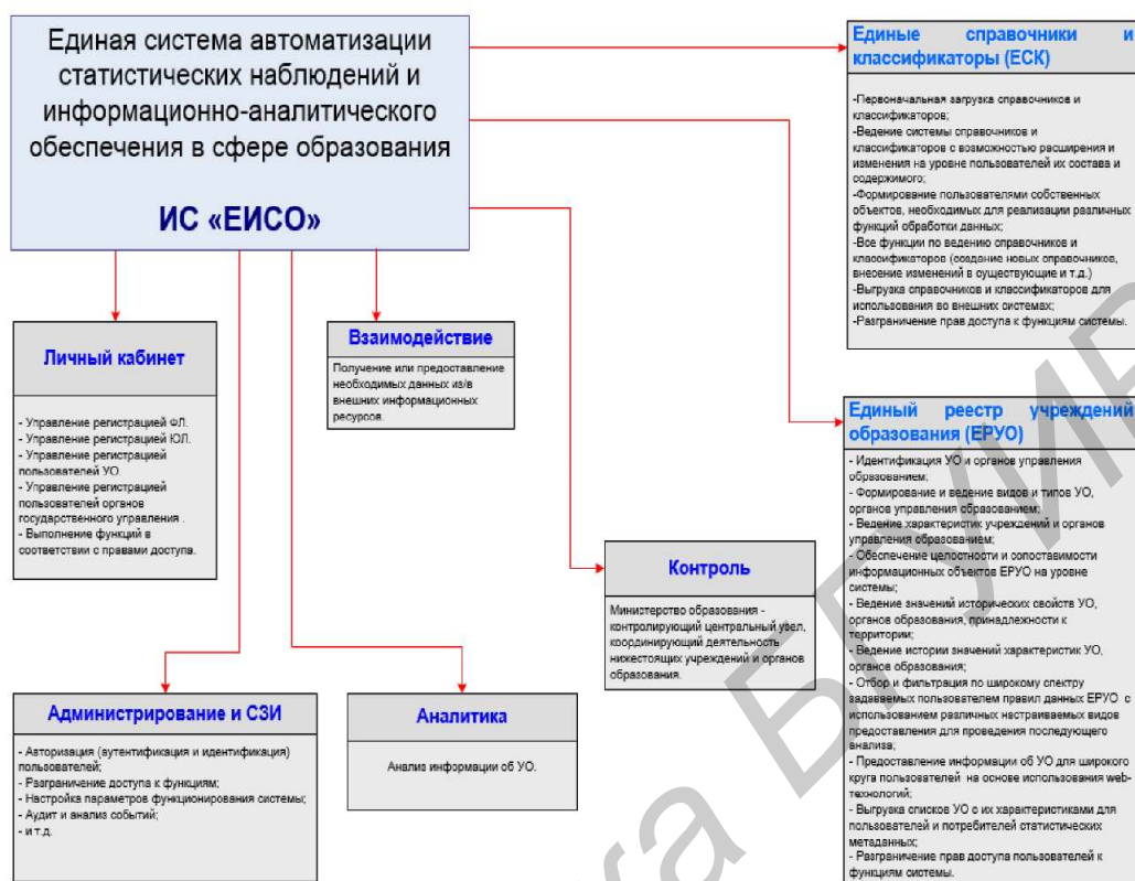
Рис. 2. Функциональная структура ПТК (ИС «ЕИСО»)

Функциональная структура системы представлена на рисунке 2.