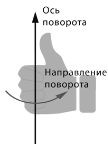
Рисунок 2 – СК гироскопа Android-устройства

Также стоит отметить неочевидное влияние температуры на работу некоторых сенсоров. Так удалось выявить погрешность в диапазоне до 10% при выполнении измерений в различных температурных условиях [1]. Погрешность не проявляется при работе сенсора в условиях постоянной температуры.